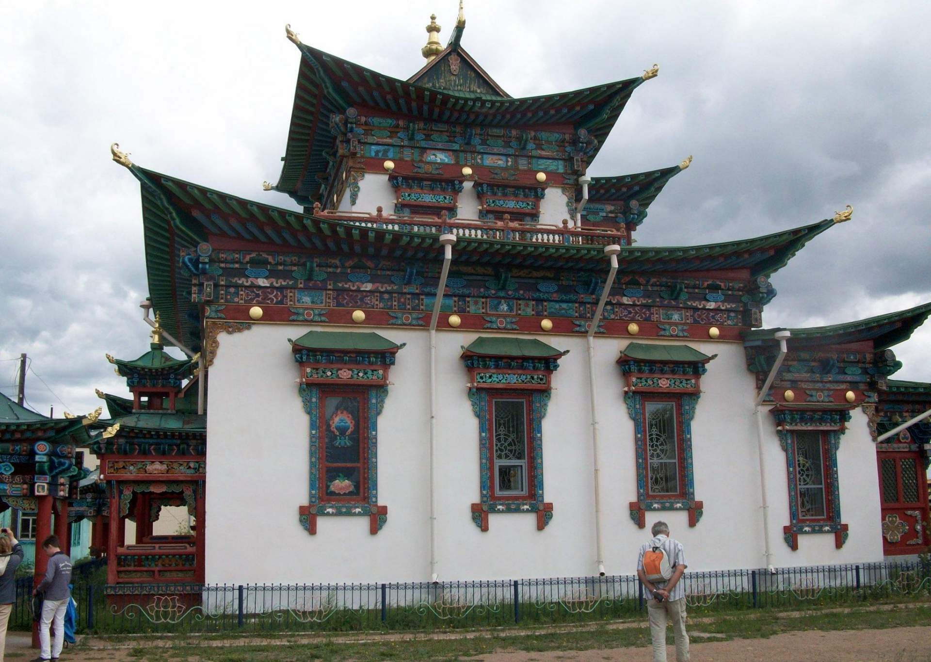
Иволгинский дацан «Хамбын Хурээ»