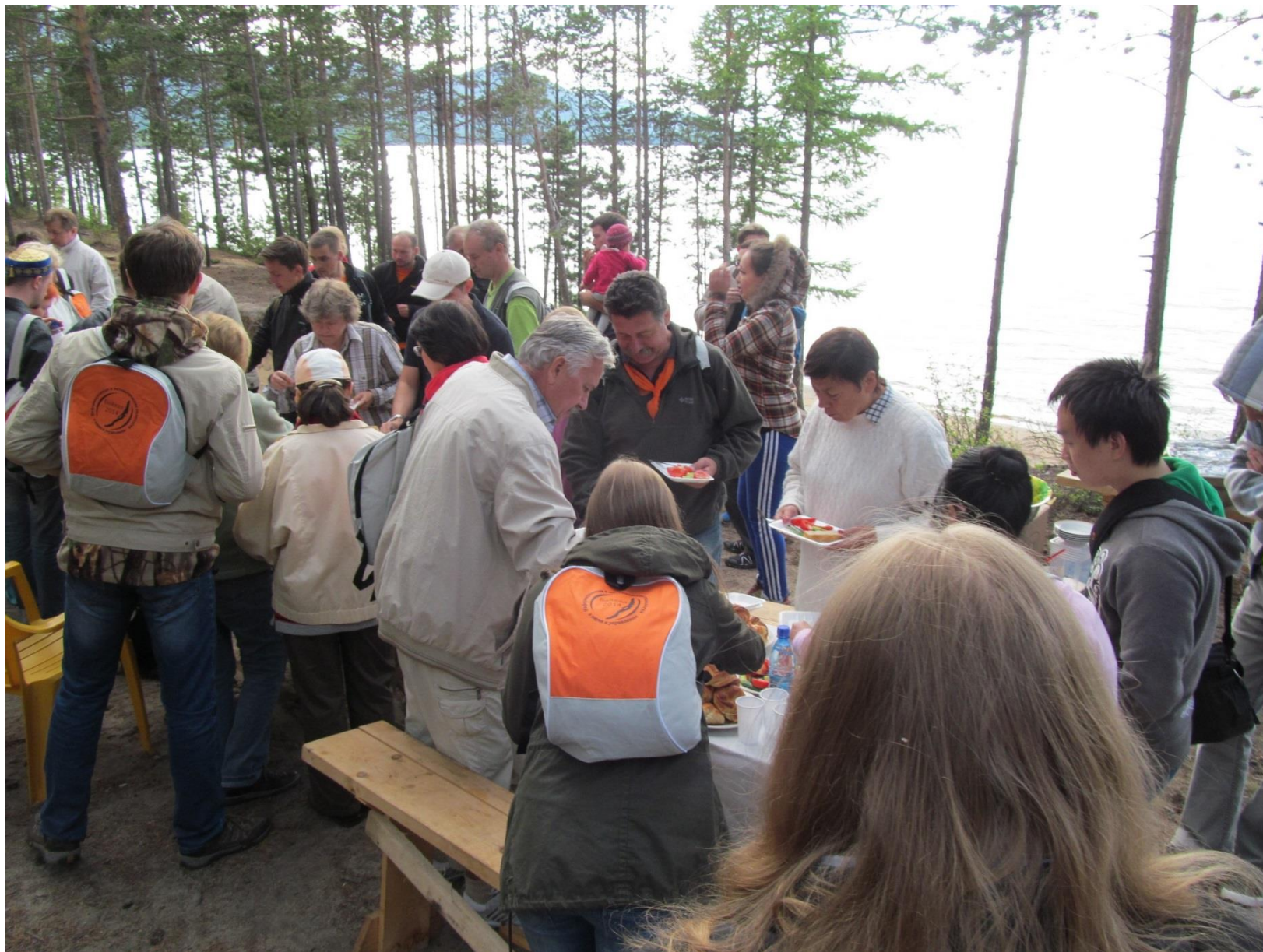
Пикник на берегу Байкала