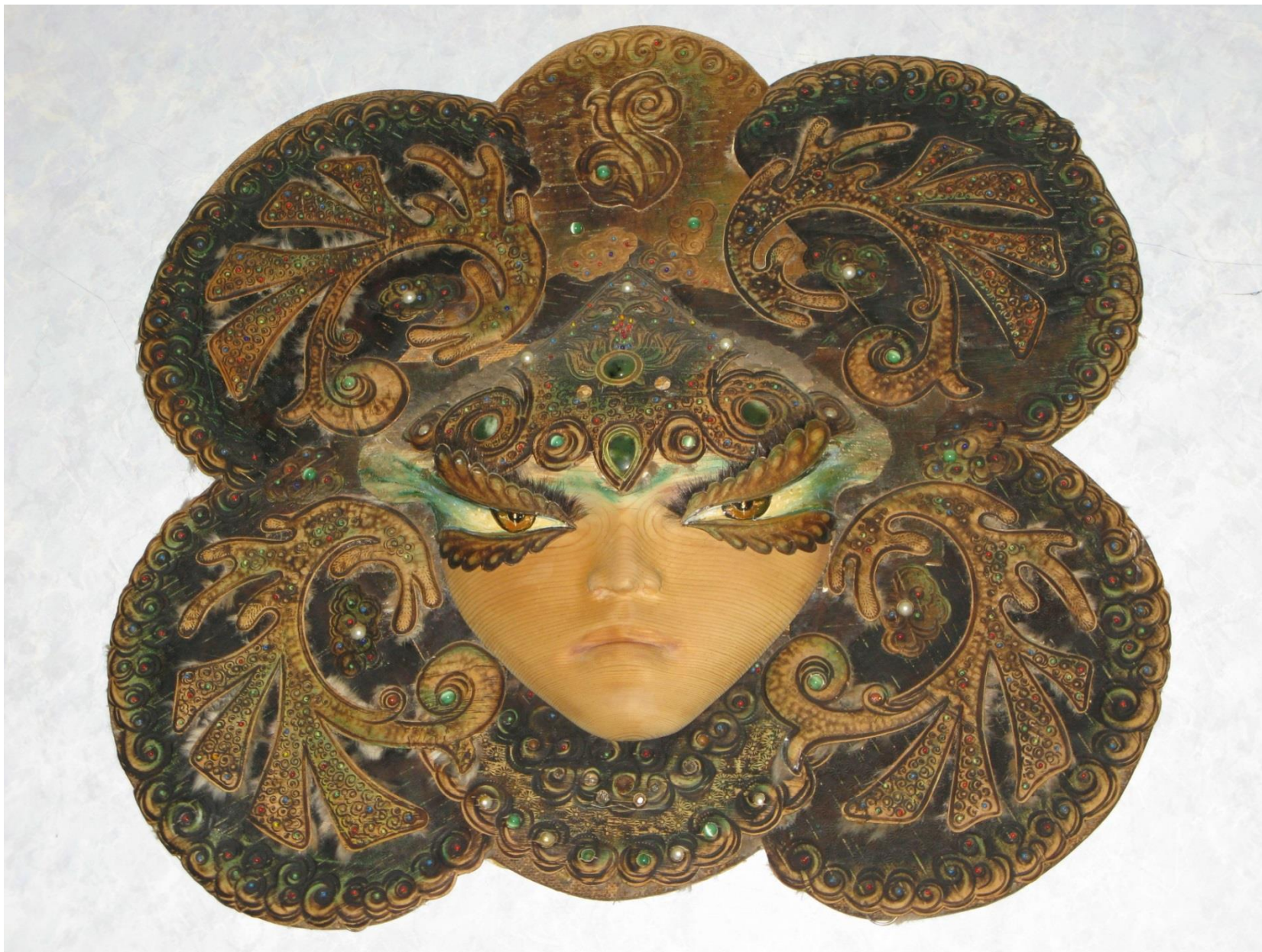
Богиня охоты (парк-музей «Светлая поляна»)