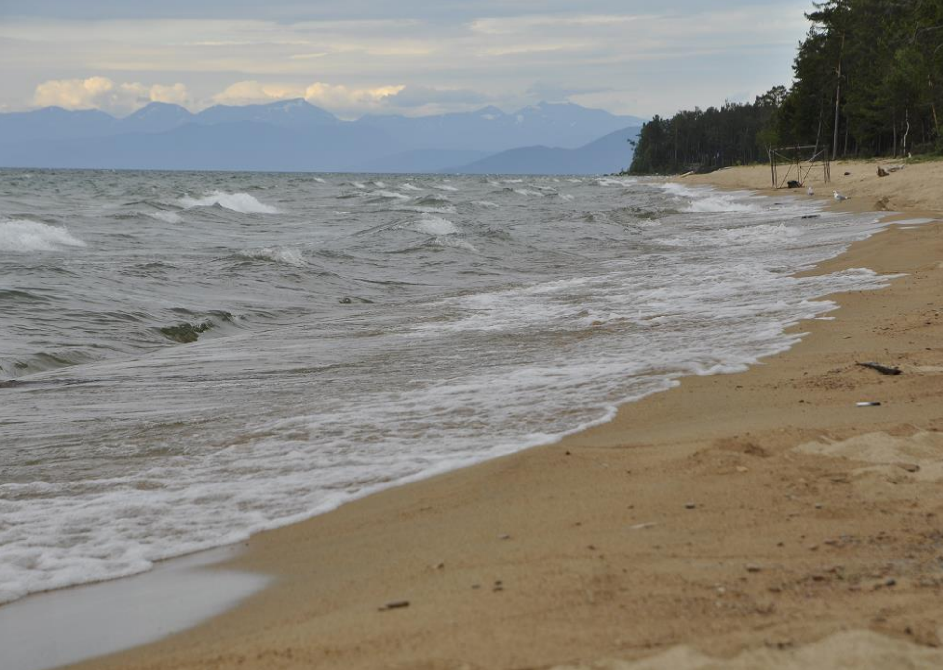
"Непогода. Байкал. Баргузинский залив"