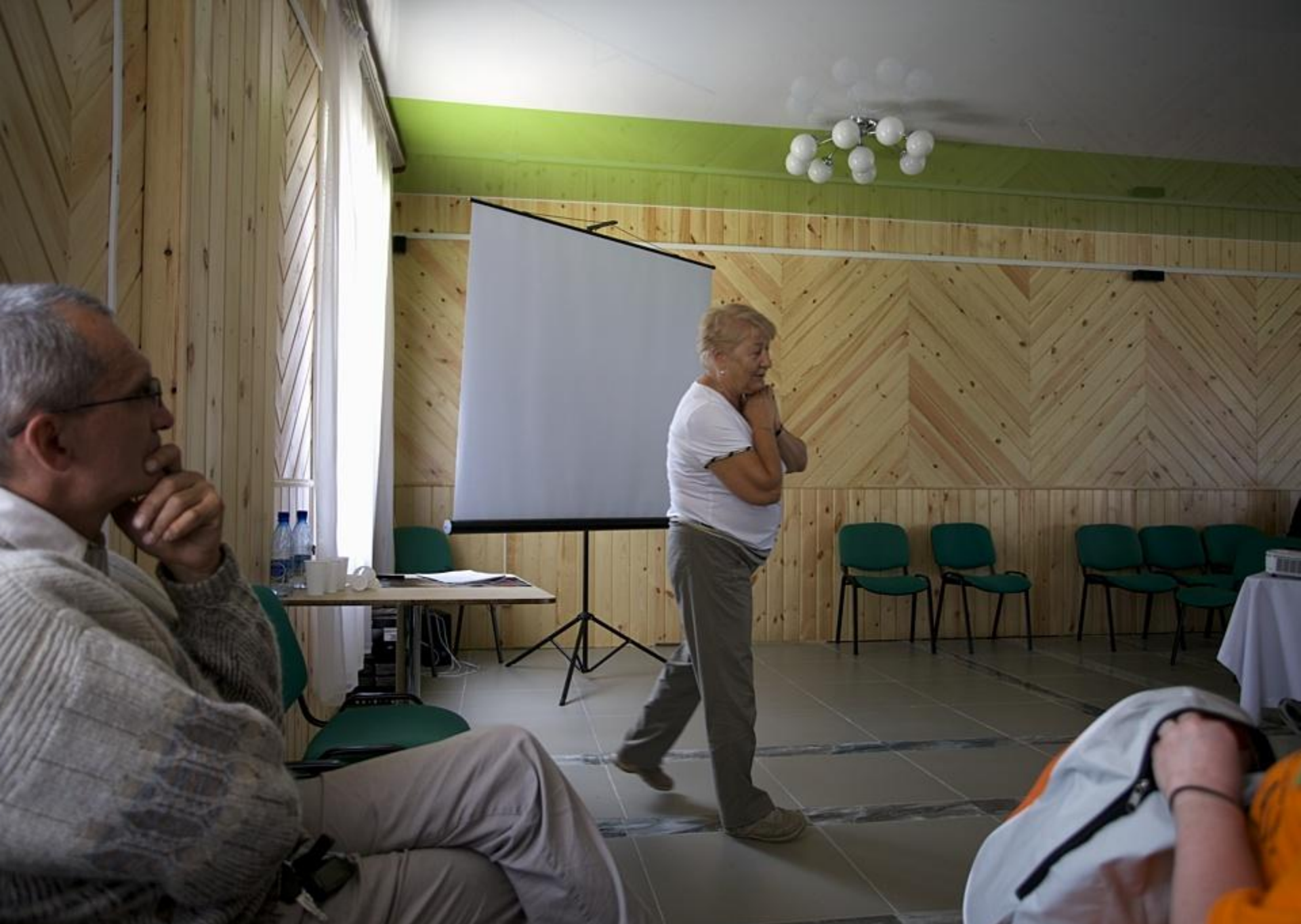
Мышление и движение