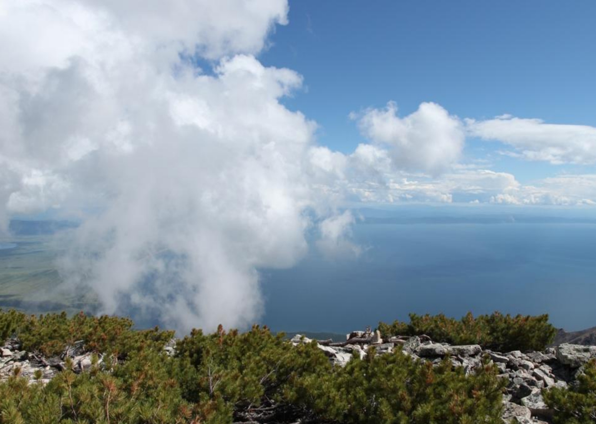
Святой Нос. Вид на Восток.