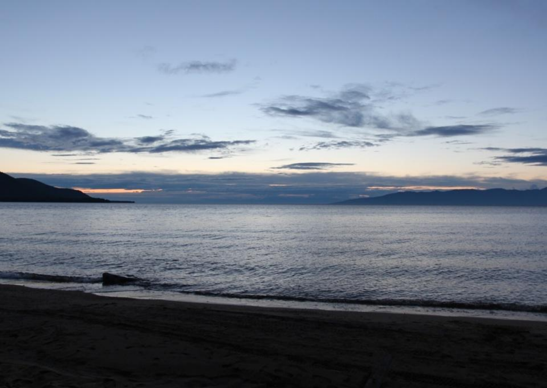
Байкал на закате