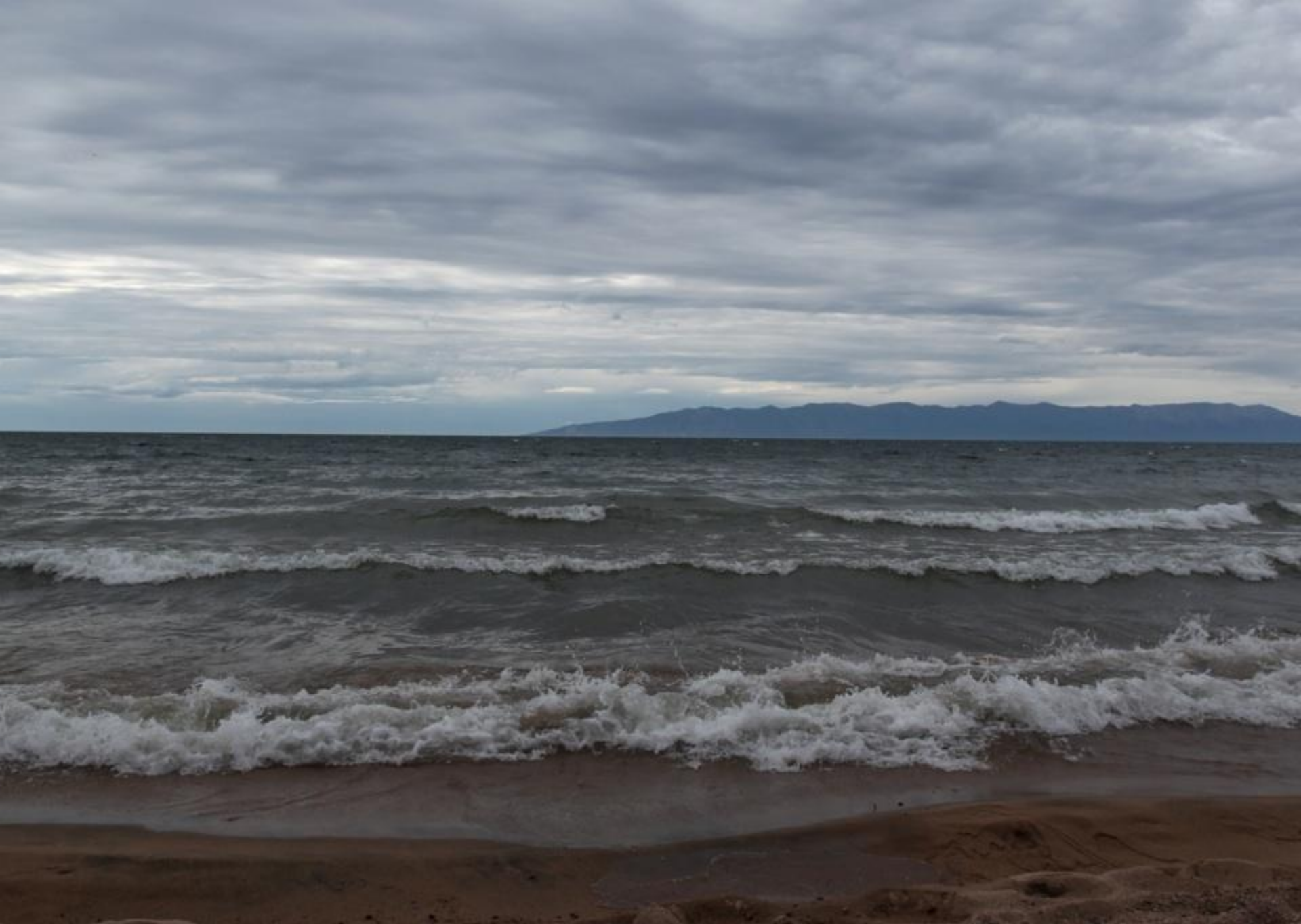
Летний шторм на Байкале