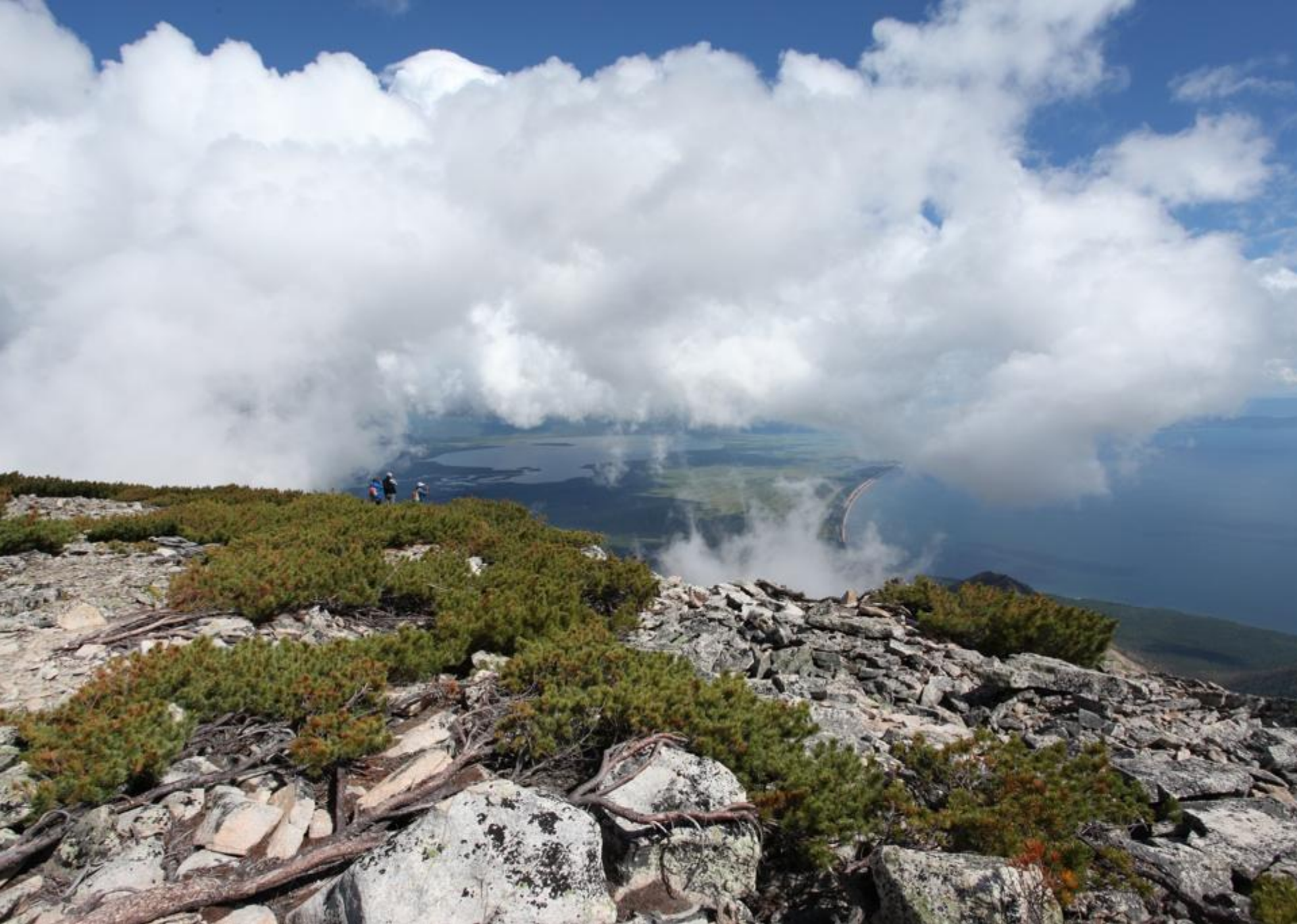
Байкал и люди