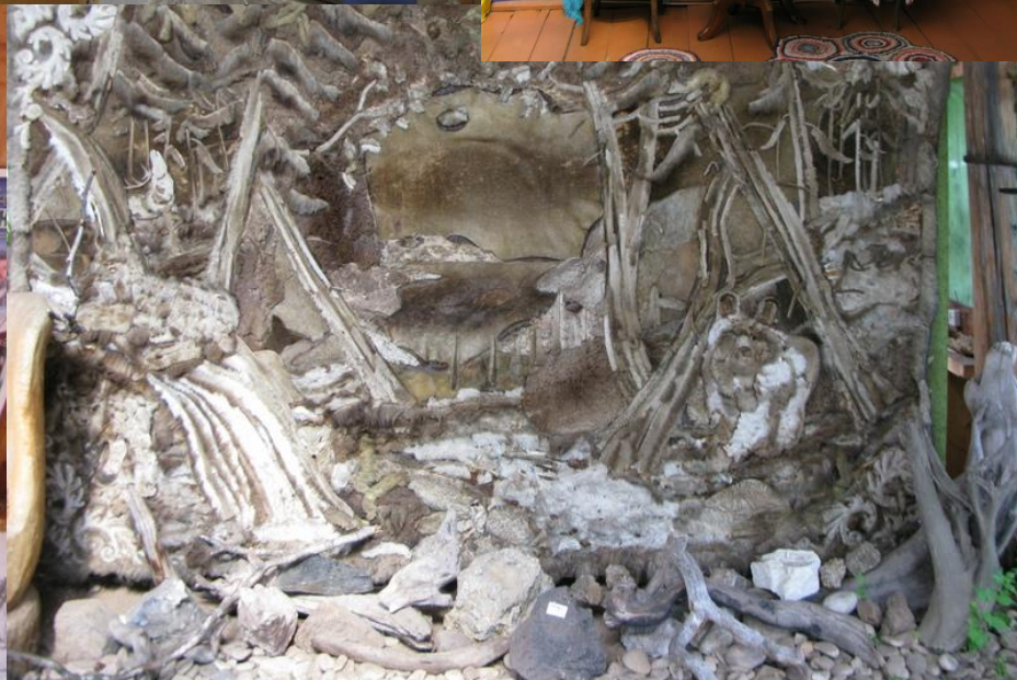
В парке-музее «Светлая поляна»