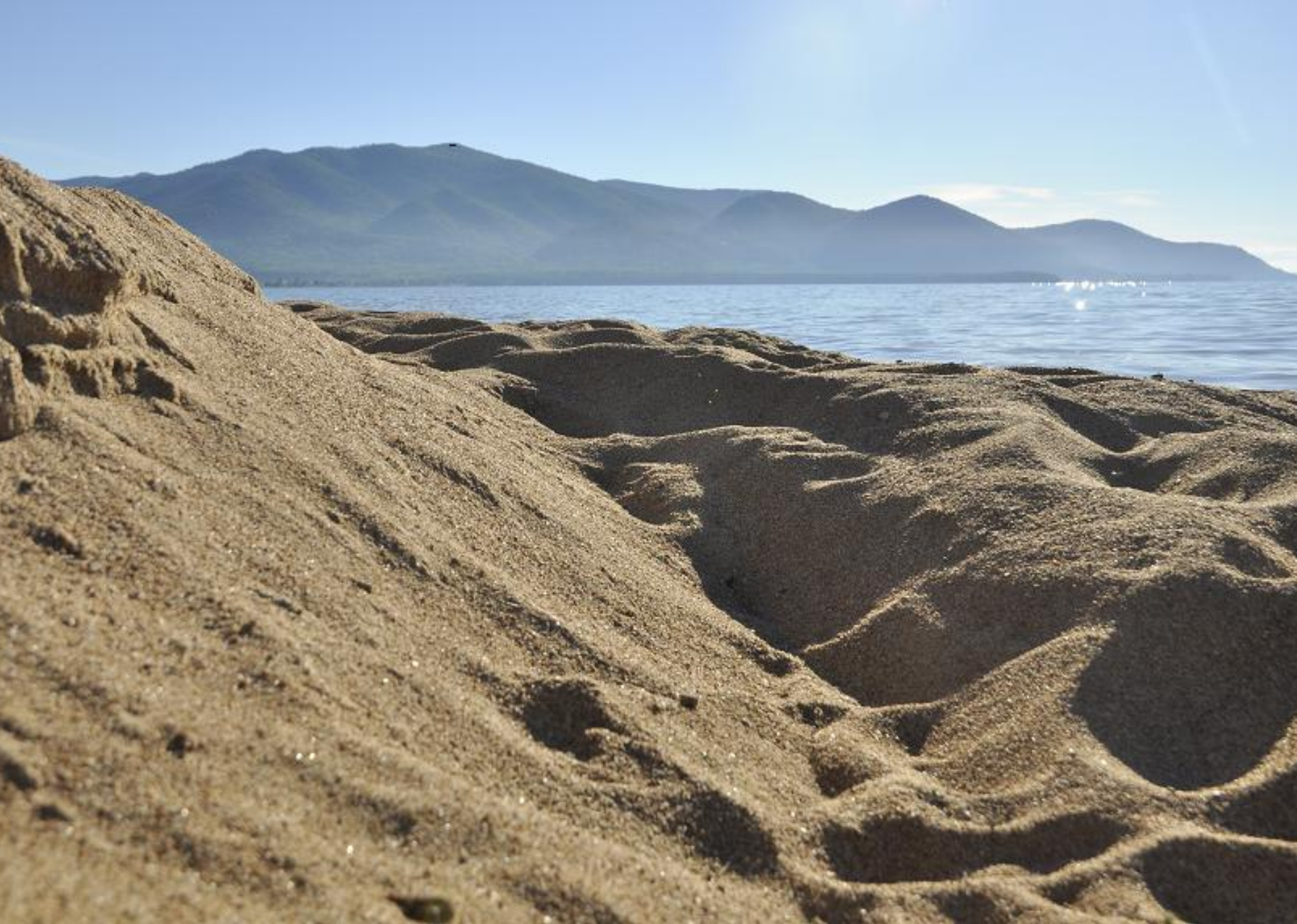
"Холодные воды - горячий песок. Байкал. Баргузинский залив"