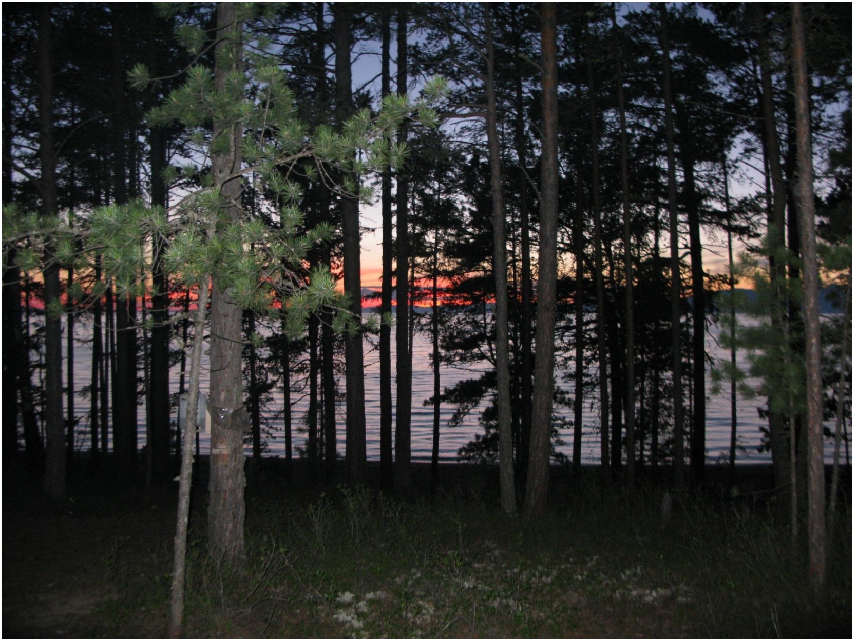
Вечер на Байкале