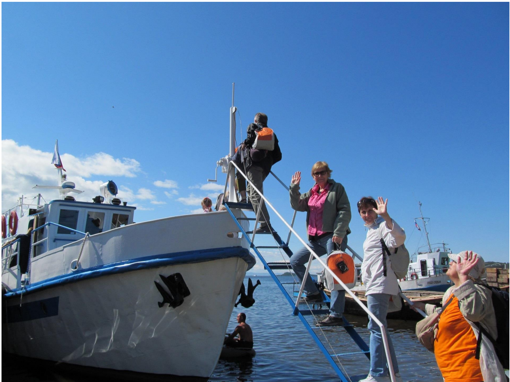
В путешествие по Чивыркуйскому заливу