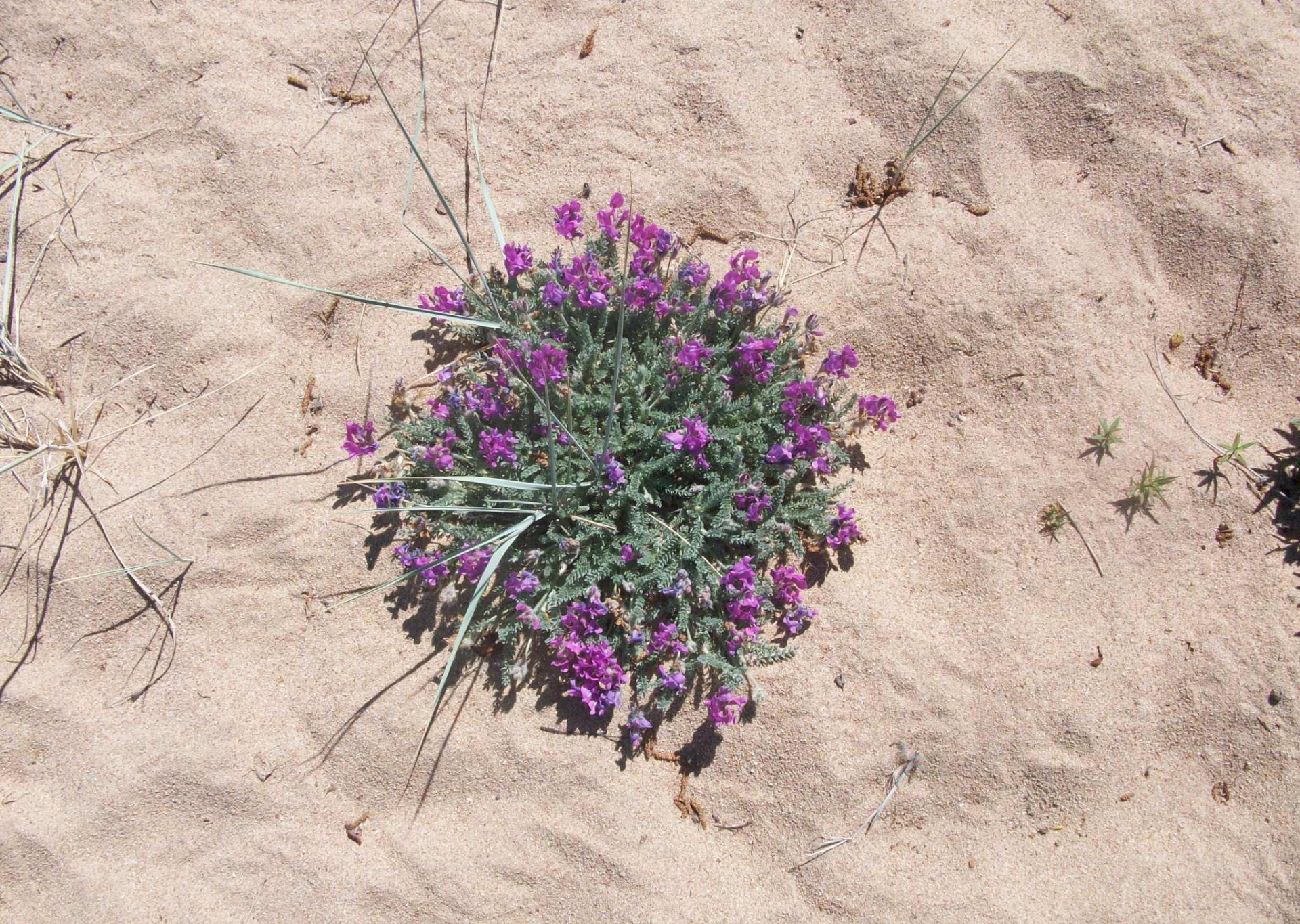
Орнамент на песке