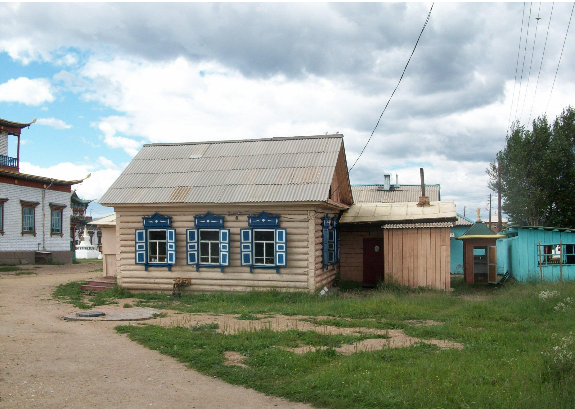
Иволгинский дацан «Хамбын Хурээ»