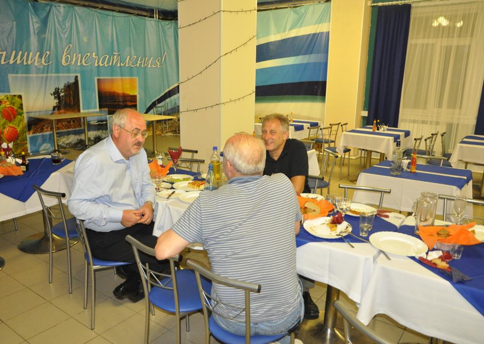
(В столовой): "Обсуждаем лучшие впечатления..."