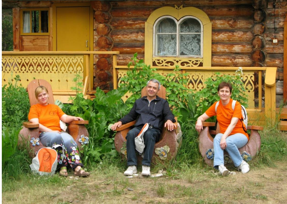
Парк-музей «Светлая поляна»