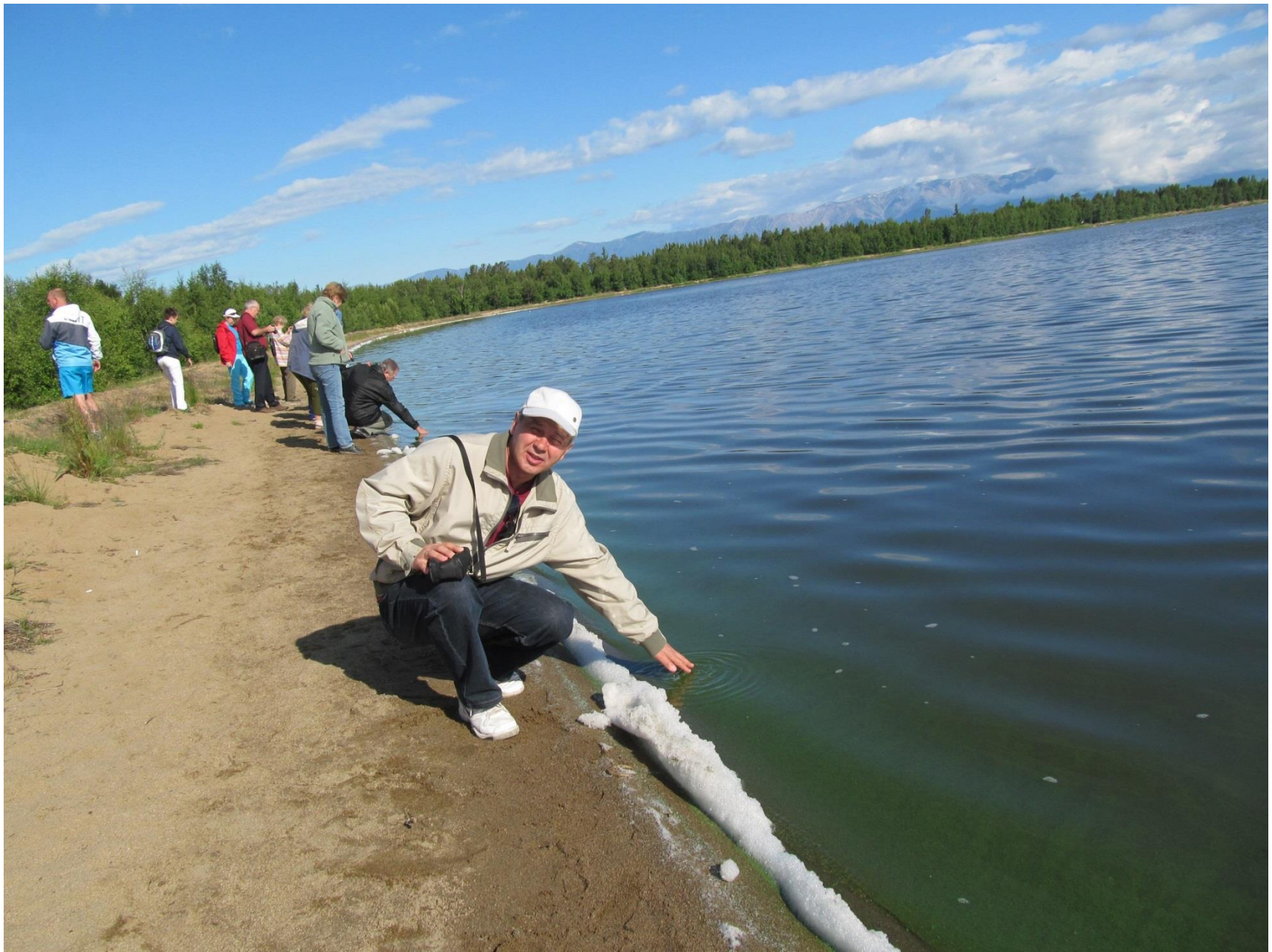
У щелочного озера