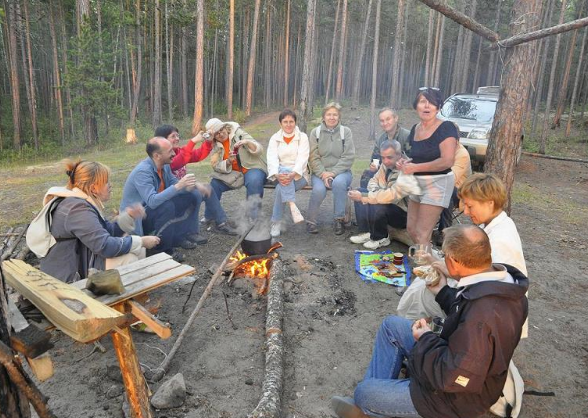
"Вечерело. У костра"