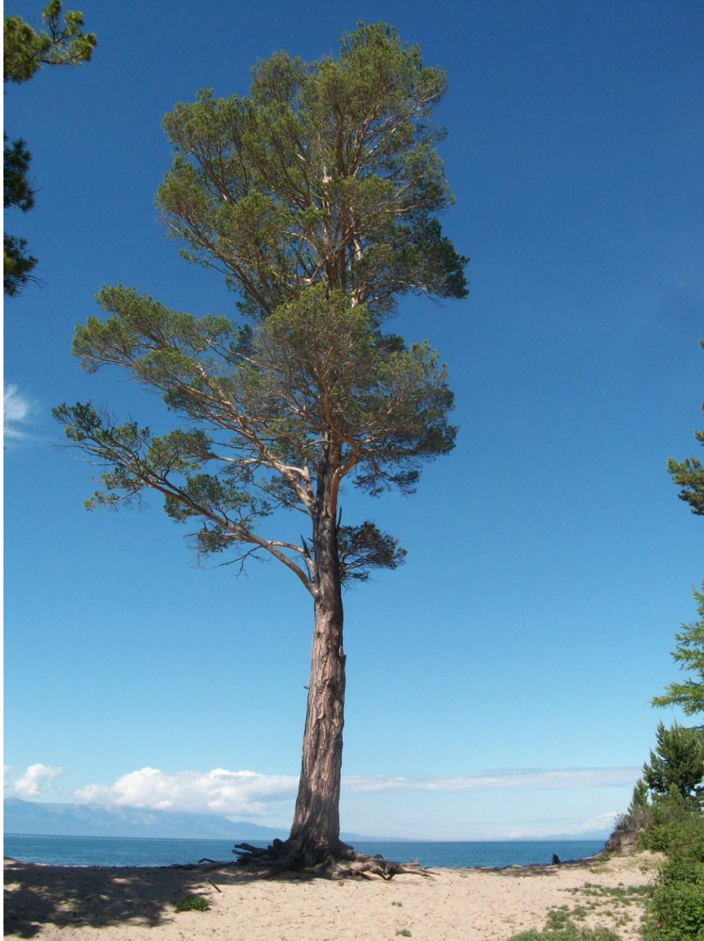
На берегу сосна стояла