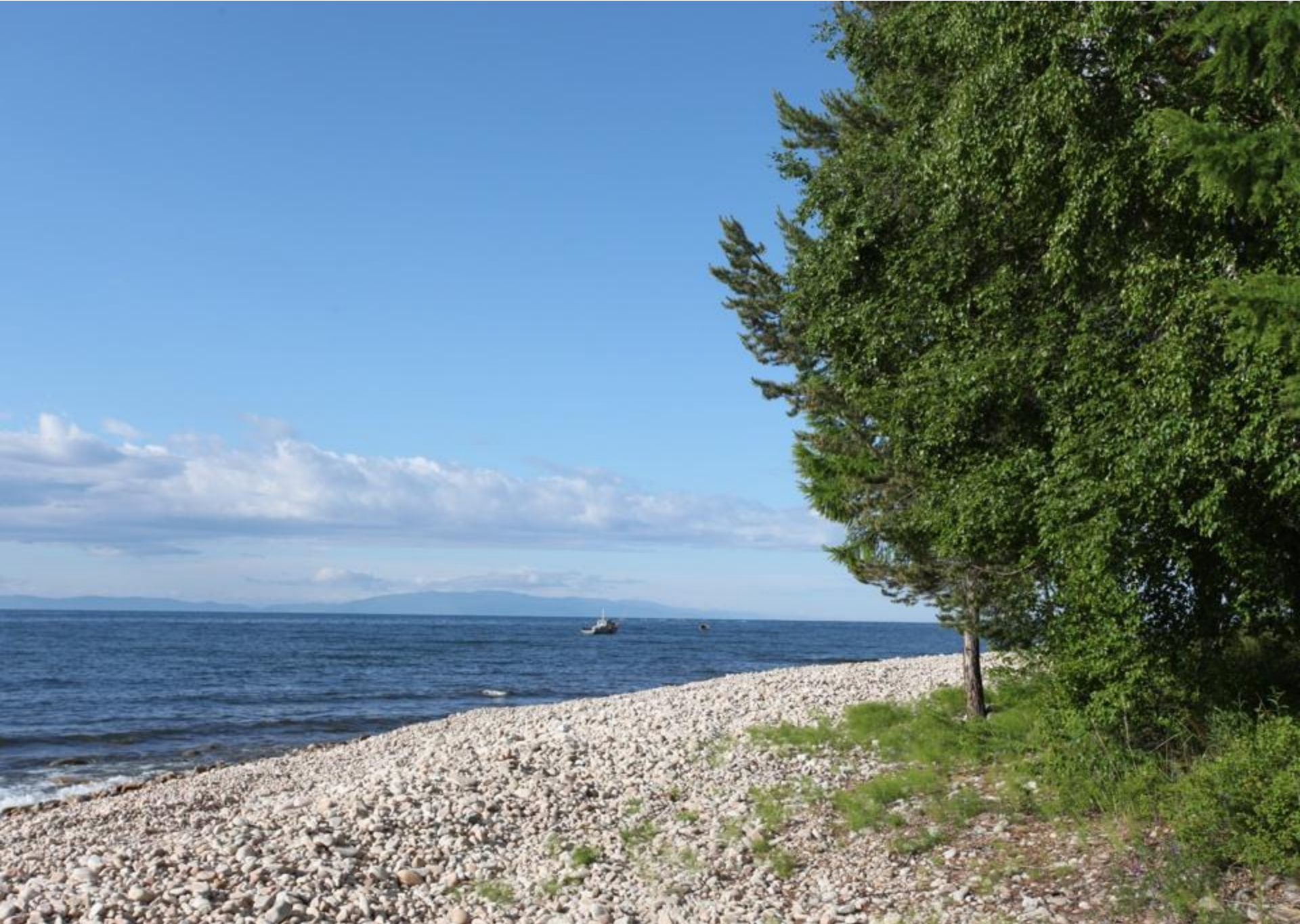
Байкал в хорошую погоду