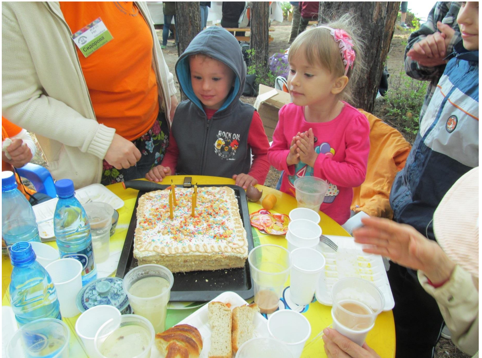
День рождения на Байкале