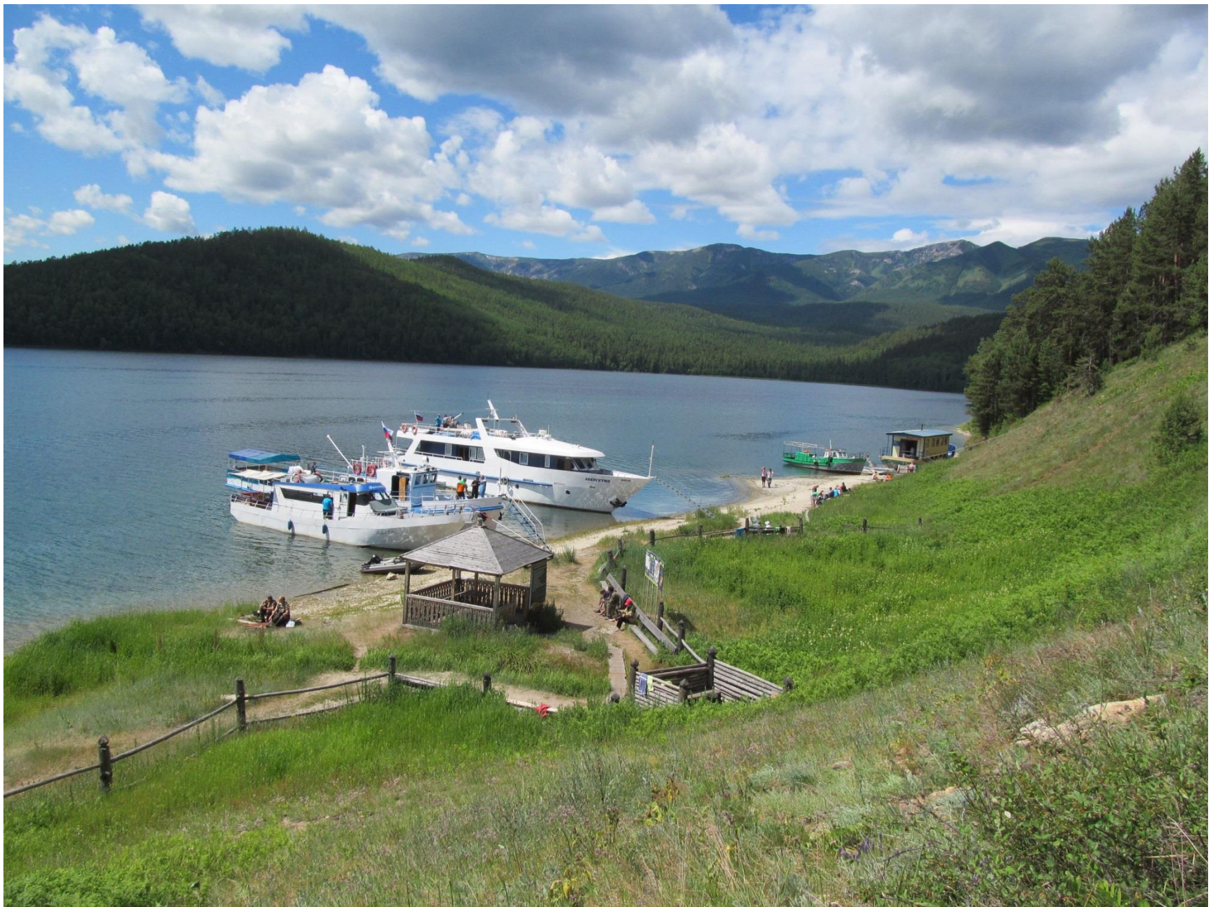
Термальные источники. Вид сверху