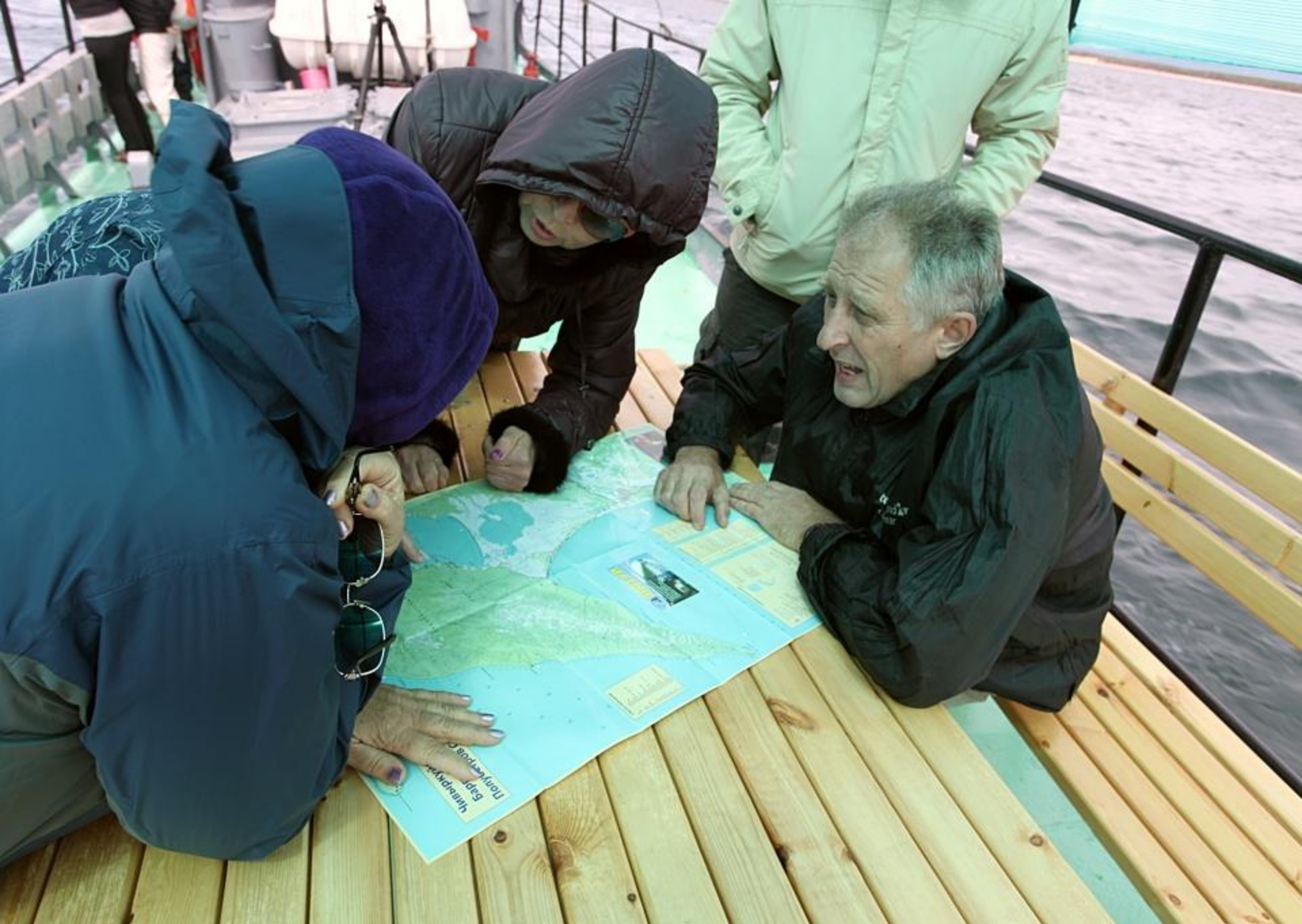
Штурман прокладывает курс