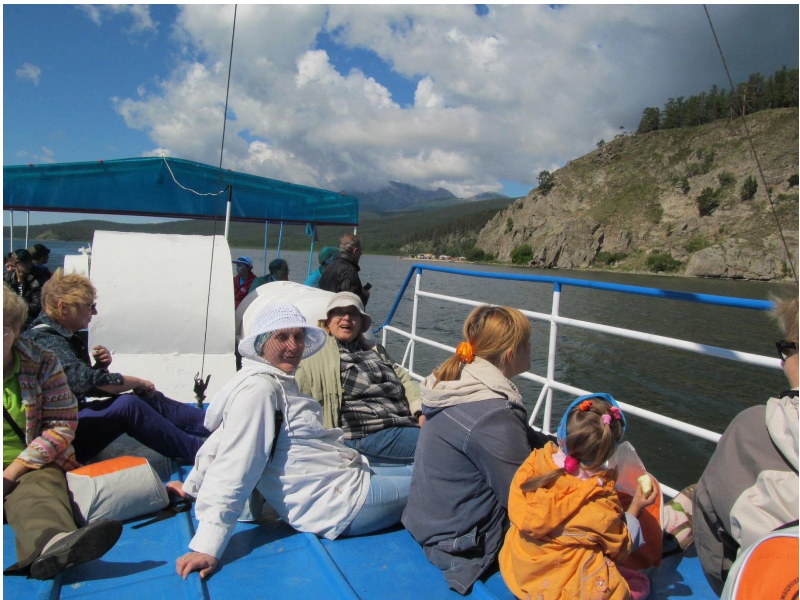
На борту «Розы ветров»