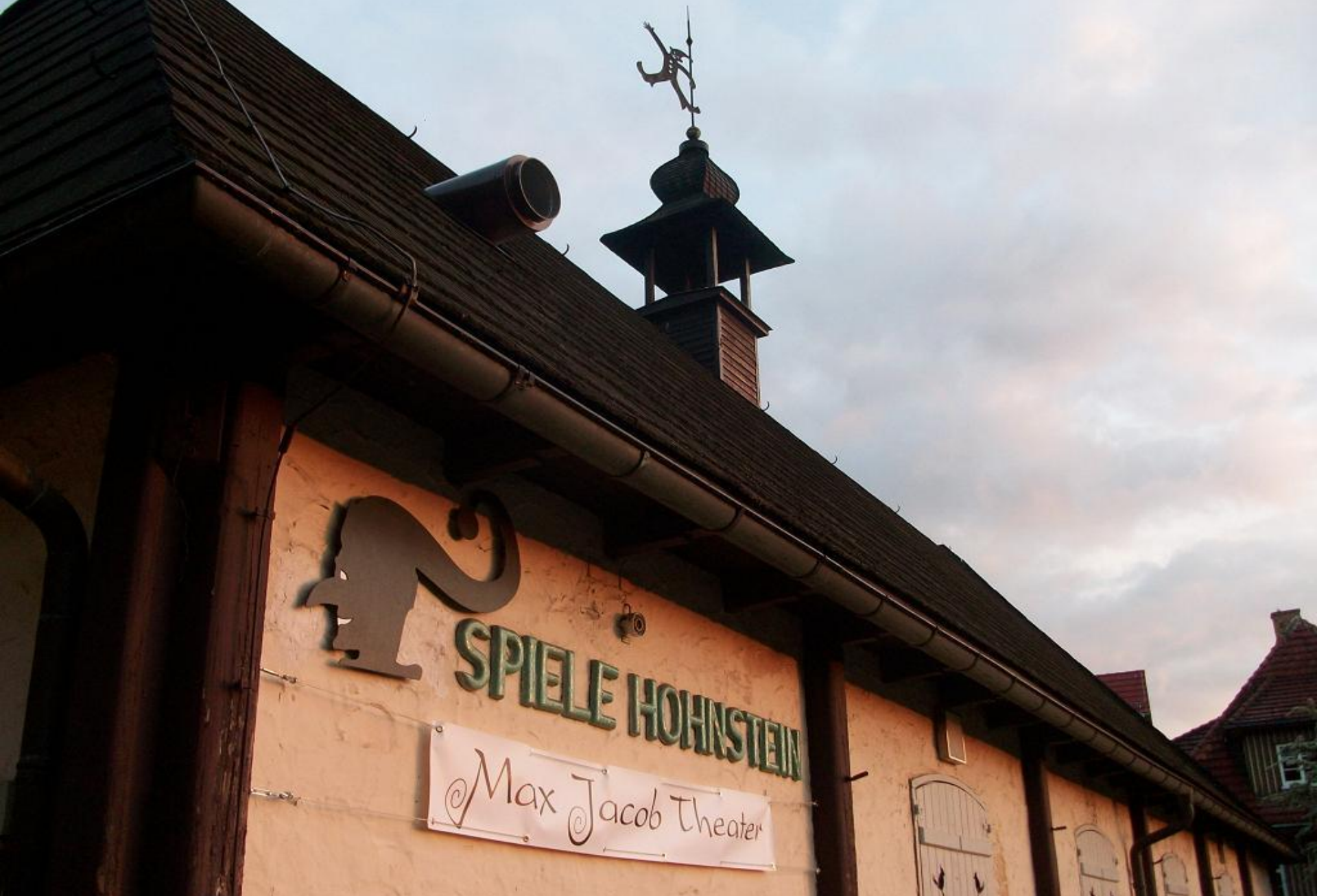
Max Jacob Theater: Kulturdenkmal in Hohnstein